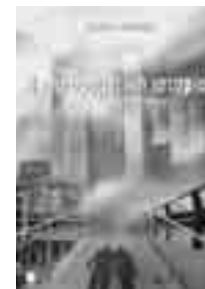
Μαρία Πάουελ Η ΠΙΟ ΔΡΑΜΑΤΙΚΗ ΙΣΤΟΡΙΑ

ΕΚΔ. ΚΕΑΡΟΣ, 2006, ΣΕΛ. 280, ΤΙΜΗ: 12 ΕΥΡΩ