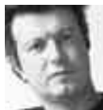
Γράφει ο Πέτρος Τατσόπουλος

Ο ΝΕΟΕΛΛΗΝΙΚΟΣ ΓΡΙΦΟΣ ΔΕΝ ΕΚΠΕΜΠΕΙ ΤΗ ΣΑΓΗΝΗ ΕΝΟΣ ΜΥΣΤΗΡΙΟΥ ΤΗΣ ΑΝΑΤΟΛΗΣ, ΟΥΤΕ ΚΟΥΒΑΛΑΕΙ ΣΤΗΝ ΠΛΑΤΗ ΤΟ ΒΑΡΥ ΦΟΡΤΙΟ ΜΙΑΣ ΕΝΟΧΙΚΗΣ ΠΡΟΤΕΣΤΑΝΤΙΚΗΣ ΠΑΡΑΔΟΣΗΣ. ΣΕ ΤΙ ΛΟΙΠΟΝ, ΣΥΝΙΣΤΑΤΑΙ; ΑΣ ΑΚΟΥΣΟΥΜΕ ΤΗΝ ΑΠΑΝΤΗΣΗ ΠΟΥ ΠΡΟΤΕΙΝΕΙ Ο ΒΑΓΓΕΛΗΣ ΡΑΠΤΟΠΟΥΛΟΣ ΣΤΟ ΤΕΛΕΥΤΑΙΟ ΤΟΥ ΒΙΒΛΙΟ